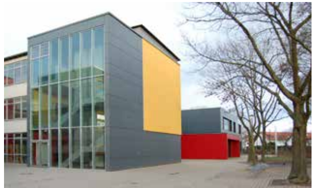
EQUITONE [pictura]: Schulen, Flörsheim am Main