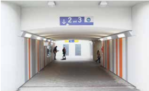
EQUITONE [pictura]: Fußgänger-Unterführung, Frankfurt am Main

Bereits in der Planungsphase eines durch Farbanschläge gefährdeten Bauvorhabens, wie zum Beispiel Fußgänger-Unterführungen, Schulen oder Fassadenbereiche in Innenstadtlage ist eine Berücksichtigung eines vorbeugenden Vandalismus-Schutz gegen Graffiti sinnvoll.