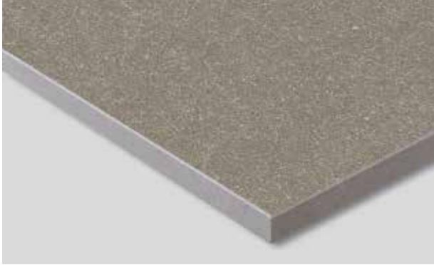
EQUITONE [natura] PRO

EQUITONE [pictura] und EQUITONE [natura] PRO Fassadentafeln mit integriertem Graffiti-Schutz bieten einen permanenten und dauerhaften Schutz gegen eine Vielzahl gebräuchlicher Marker-Farben und Sprühlacke.